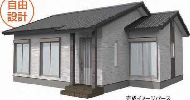
完成イメージパース