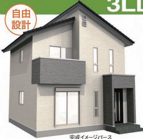
完成イメージパース