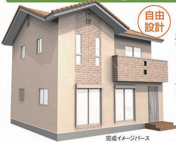
完成イメージパース