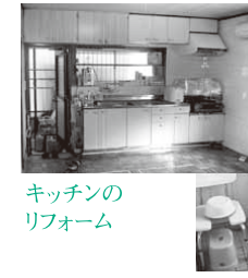
キッチンのリフォーム

構造現場見学会では、新築・建て替えのご相談はもちろん、リフォームのご相談会も同時開催いたします。住まいで気になるところがある方は、ぜひお気軽にご来場ください。しっかりお話を伺います。