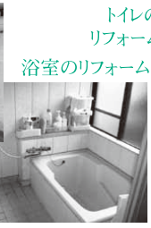
トイレのリフォーム 浴室のリフォーム