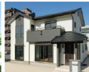
22畳のLDKで、7人家族に嬉しいゆとりあふれるふれあいの住まい。平成22年12月施工