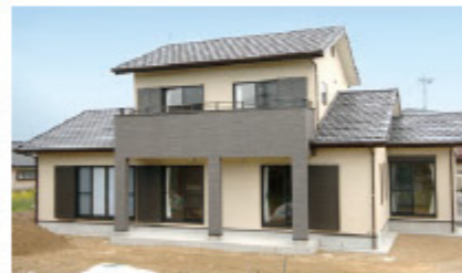
無垢材をふんだんに使用し、家族の健康を考えた住まい。平成22年4月施工