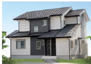
南側に配置したLDKで、太陽の恵みからただ感じる住まい。平成22年2月施工