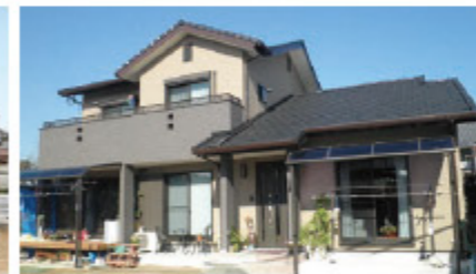
3世代で生活する、ゆとりのある間取り。平成22年12月施工