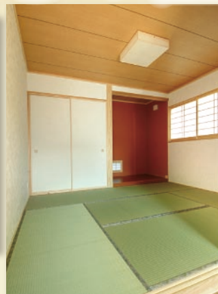
扉を開けると一体的に利用できる和室とLDK。急な来客にも対応できます。