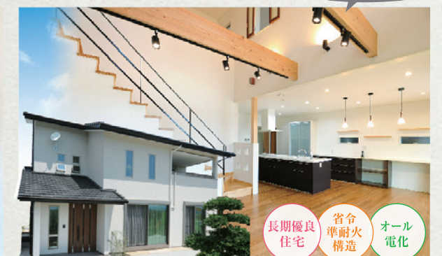
久留米市(2017年6月竣工)