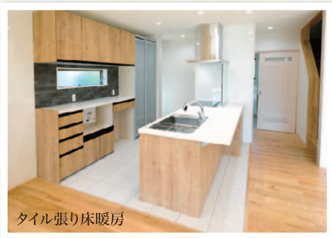
タイル張り床暖房